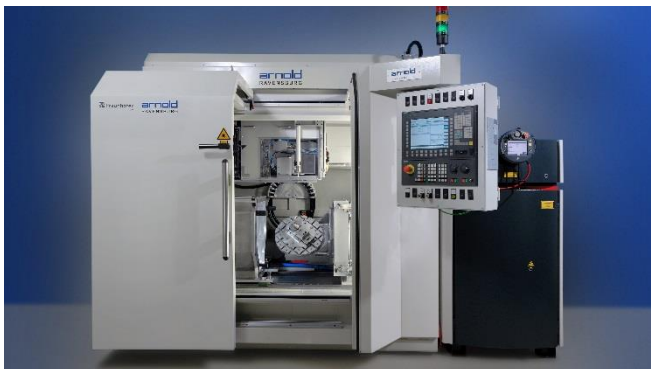
Bild 2: Für das Laserpolieren sind inzwischen industrietaugliche Systeme verfügbar.