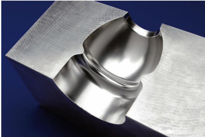
Bild 3: Teil einer laserpolierten Blow-Mold aus Stahl.